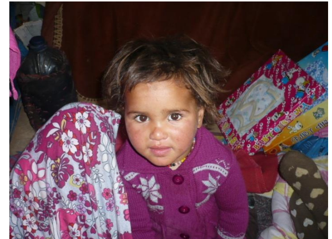
La grande sœur pas forcément contente, grimpe sans arrêt sur sa mère !