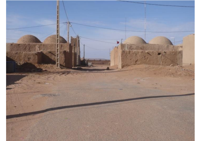
C'est à Taous que s'arrête la route goudronnée