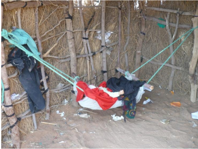
Un joli berceau à l'abri du vent