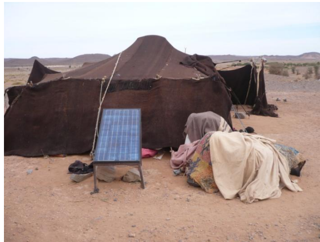
Visite chez les Nomades à JDAYD 2