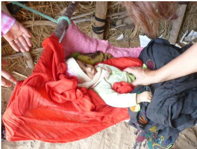
Le bébé nous régale de sourires !