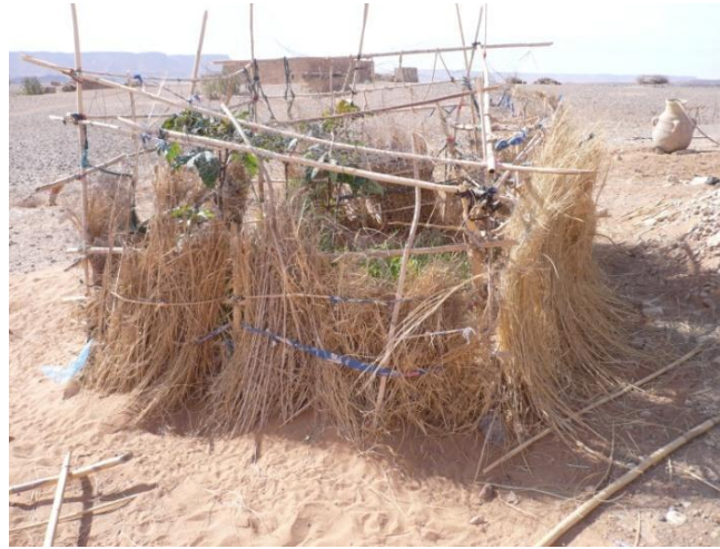
Un potager protégé des chèvres et du vent