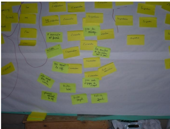
« L'arbre à problèmes » Chaque femme a pu afficher sa parole.