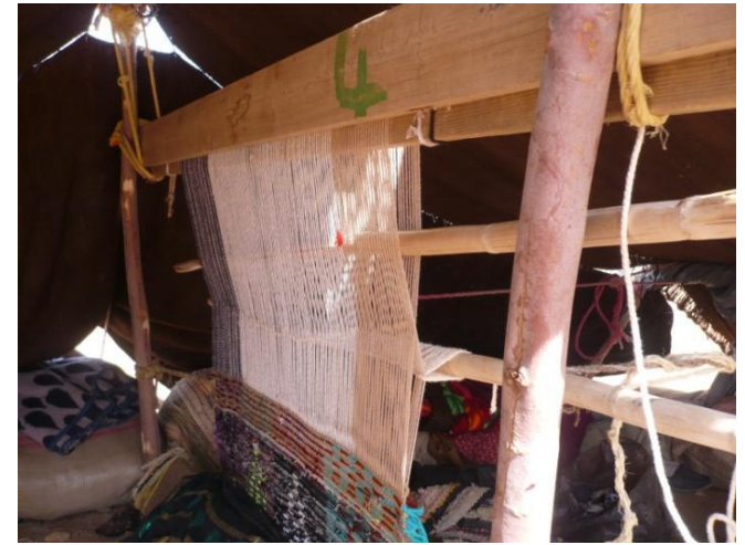
Un métier à tisser installé sous la tente