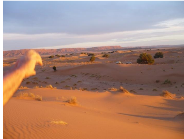
9 classes, 331 internes dont 125 filles.