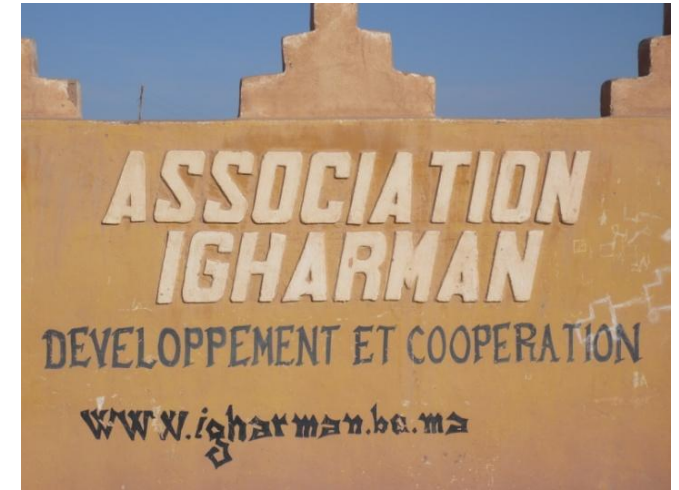
Avec l'Association, Les femmes veulent redémarrer L'atelier couture-tapis