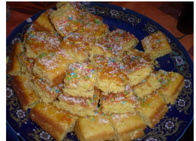
Et bien sûr tout finit avec le thé et les gâteaux !