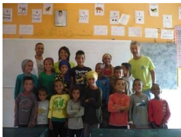
Prise de contact à Ouzina