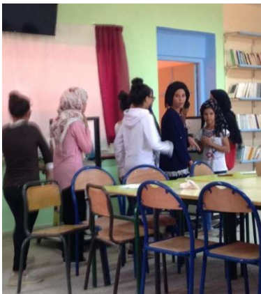
Le petit chaperon bleu !

En lien avec l'Association Solibreiz, et grâce au fonctionnement de la campagne par HelloAsso et un don du Rotary de Rive de Gier, nous allons poursuivre le projet par une nouvelle commande de livres et l'acquisition d'une photocopieuse demandée par l'équipe enseignante. Pour info, l'internet marche super bien au collège cette année.