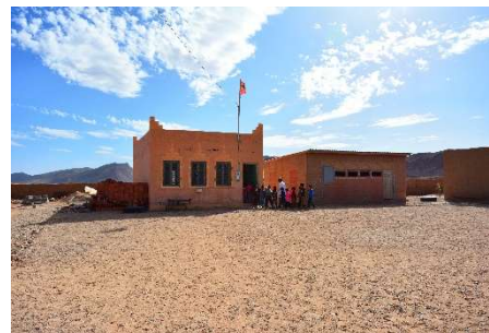
L'école de Jdaïd