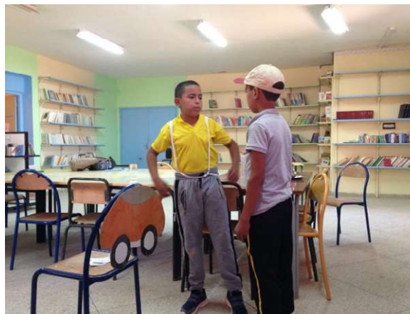
Jeux de mots (vos papiers ?)